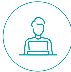
A school counsellor