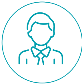
A trusted adult